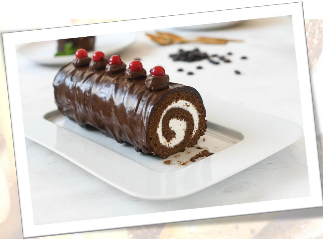
Brazo gitano de chocolate