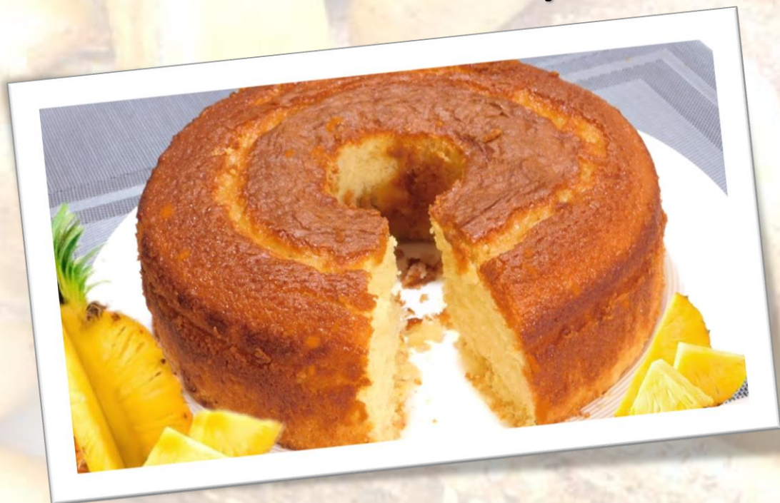
Bizcocho redondo de Piña