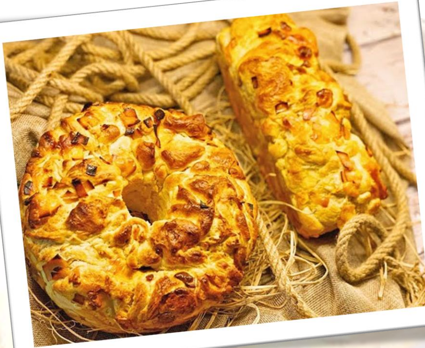
Pan de puerro y cebolla