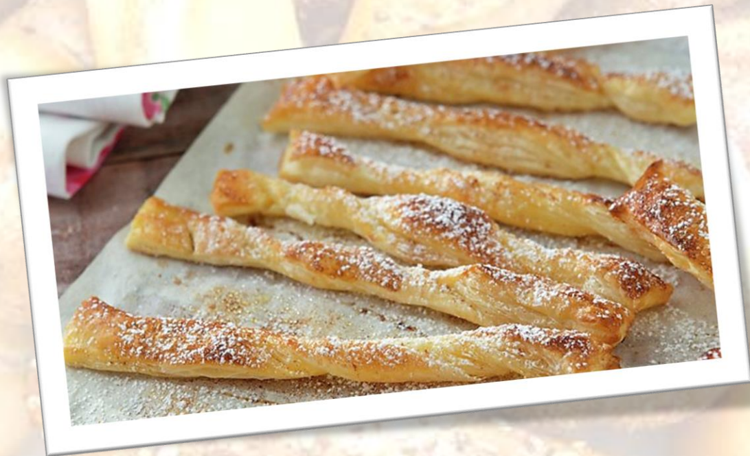
Lasitos de canela