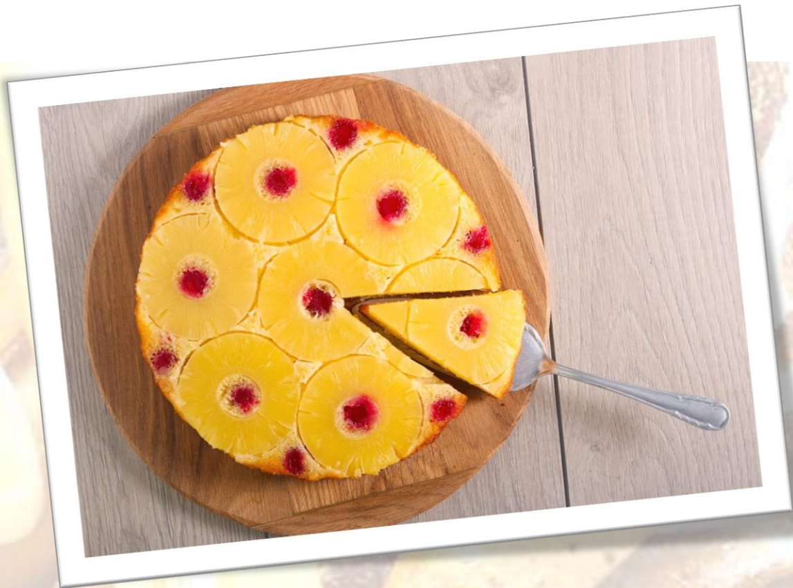
Bizcocho volteado de piña