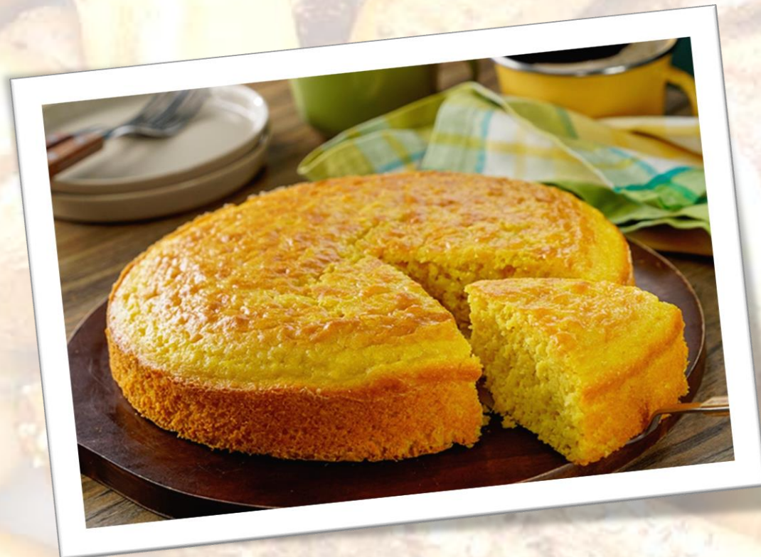
Tarta de Maiz