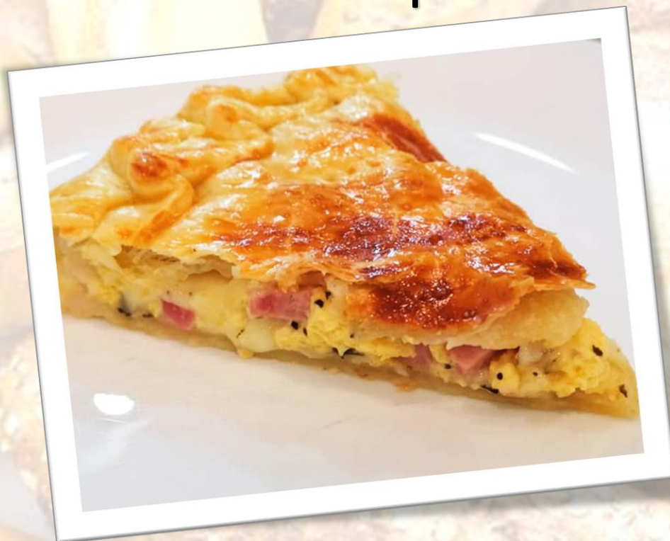
Tarta de jamon y queso