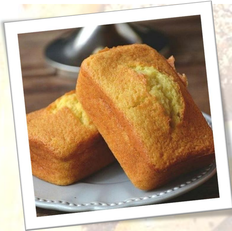
Torticas de Vainilla y de Maíz