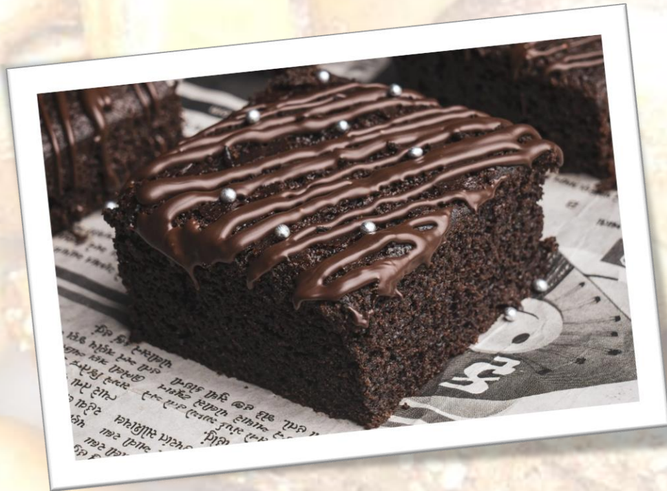
Biscocho de chocolate