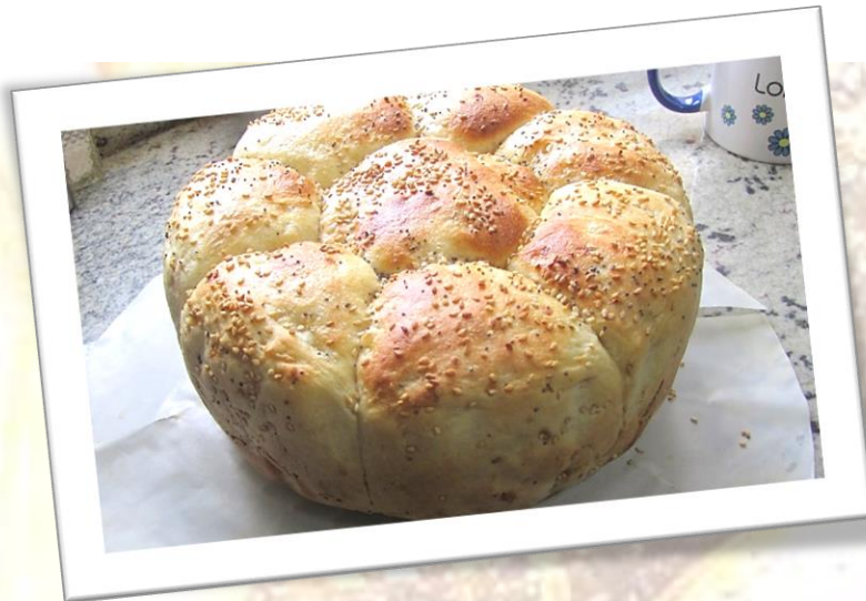
Pan integral blanco y ajonjolís