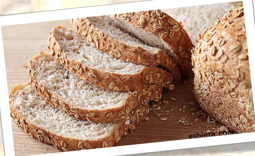
Pan de avena