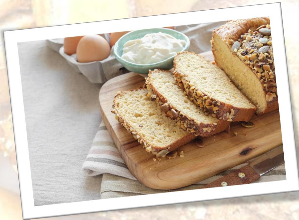
Pan de almendras