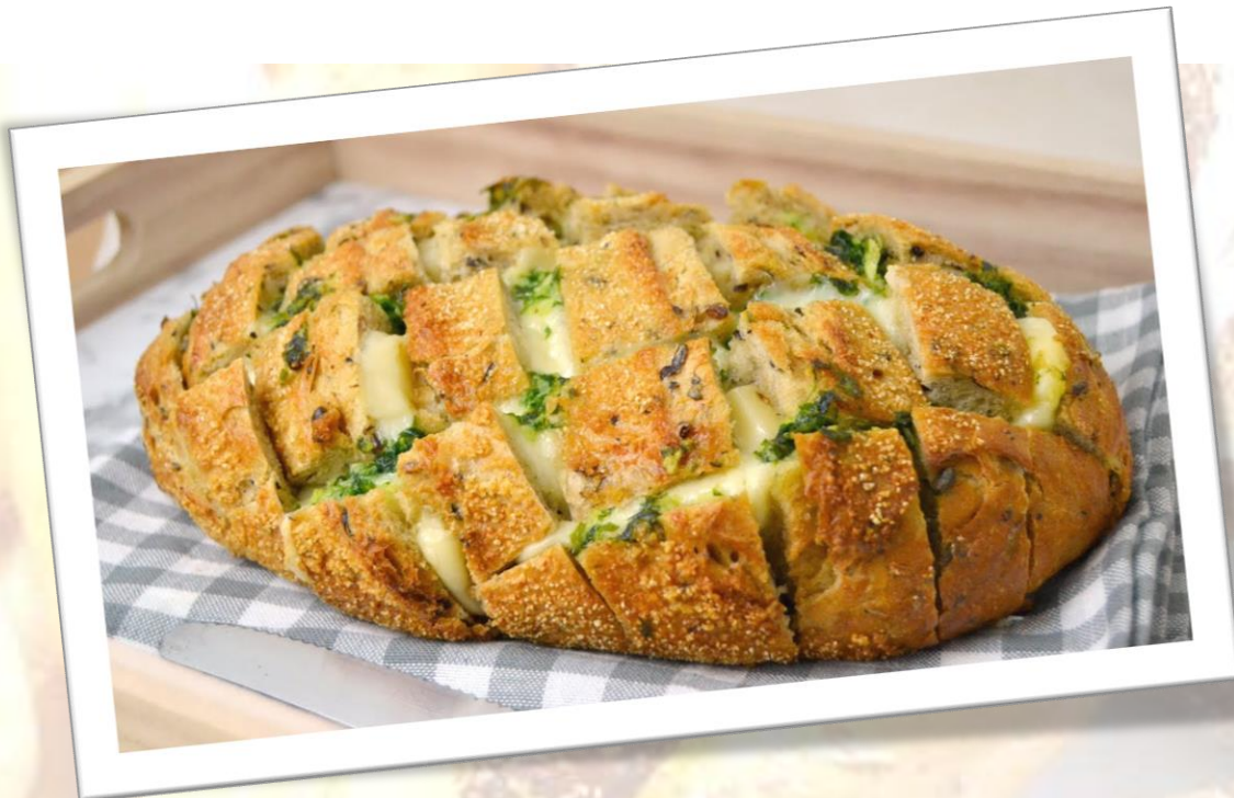
Pan de perejil y ajo