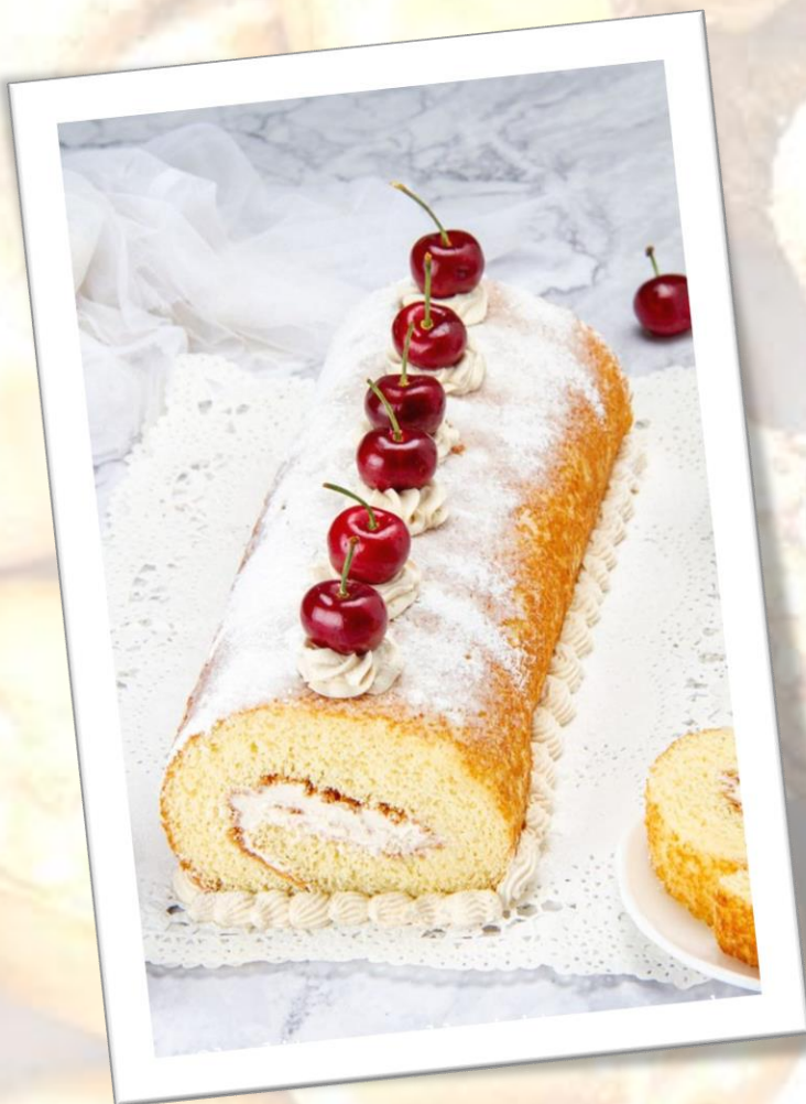
Brazo gitano de vainilla