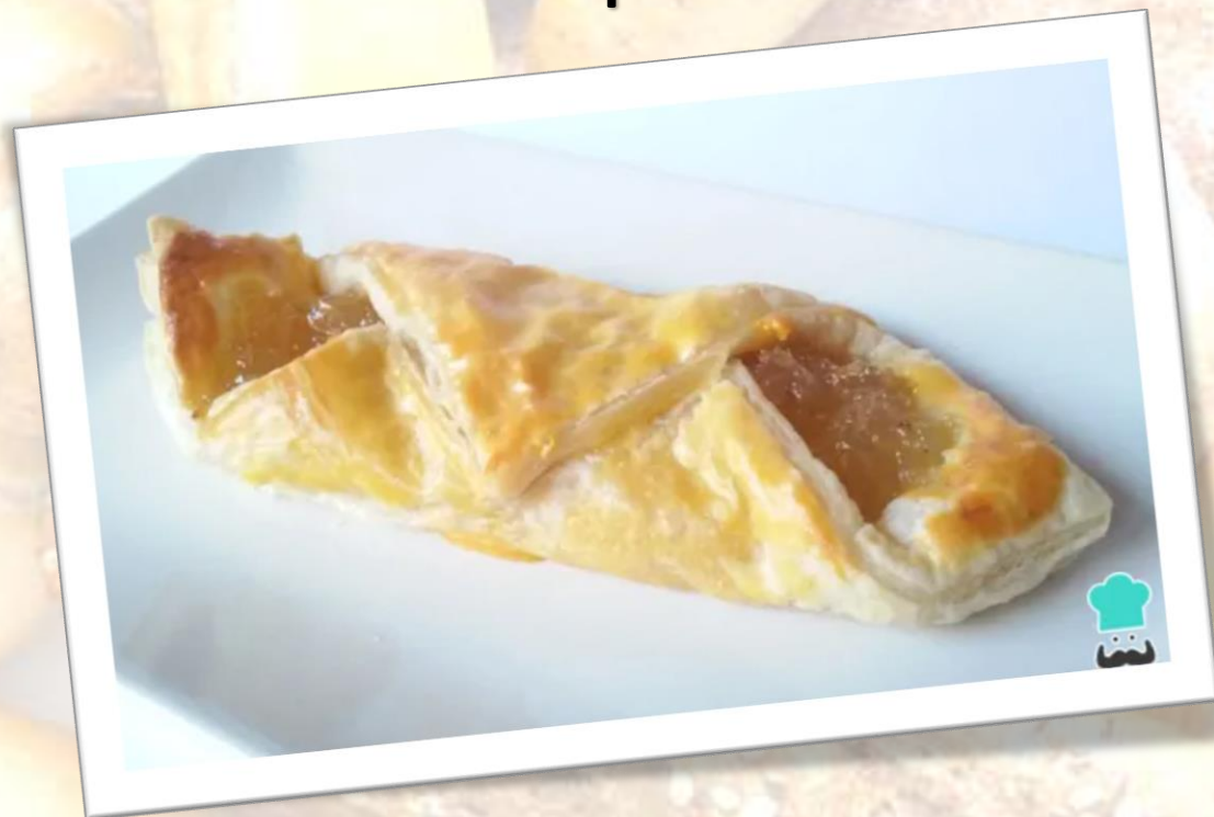
Cabello de angel