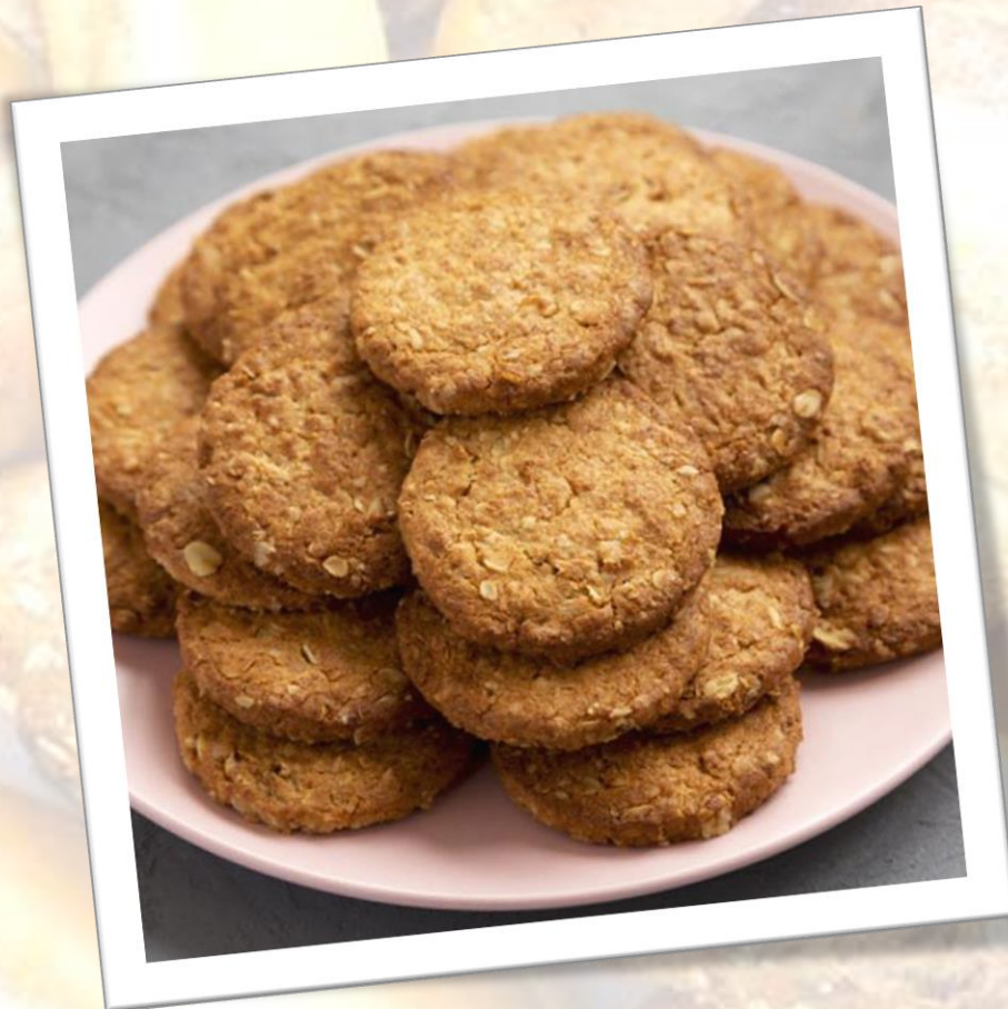
Galletas de avena